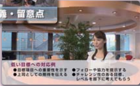
低い目標への対応例 ●目標項目への影響性を示す ●フォローや協力を促す ●上層としての期待を伝える ●チャレンジ性のある目標、しべしべを部下に考えてもらふ