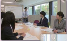
一般的な人事評価制度の基本となるしくみと運用を紹介