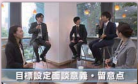
目標管理の基本的なプロセスを学び面談の意義や留意点などを紹介しながら面談に臨みます