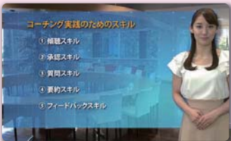
コーチング実践のためのスキル ①傾聴スキル ②承認スキル ③質問スキル ④裏付けスキル ⑤フィードバックスキル

中間面談、期末面談・フィードバックの進め方に加えて、日常業務におけるコーチングの基本スキルを紹介