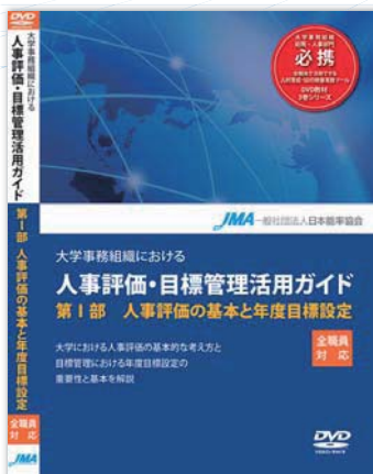
人事評価の基本と年度目標設定