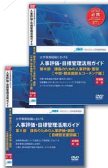
課長のための人事評価・面談 —目標設定面談編