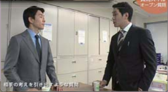
質問スキル オープン・クローズ