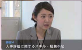
課題点 人事評価に関するスキル・経験不足