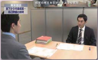
日常業務 部下からの進捗確認・自己評価の説明